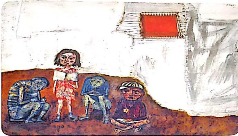
Juanito aprende a leer, 1961.

El artista plástico Antonio Berni (1905-1981) se caracterizó por la realización de obras de gran sensibilidad social que reflejaban las condiciones de vida de los sectores populares a través de diferentes estilos y técnicas. Juanito Laguna es uno de sus personajes.